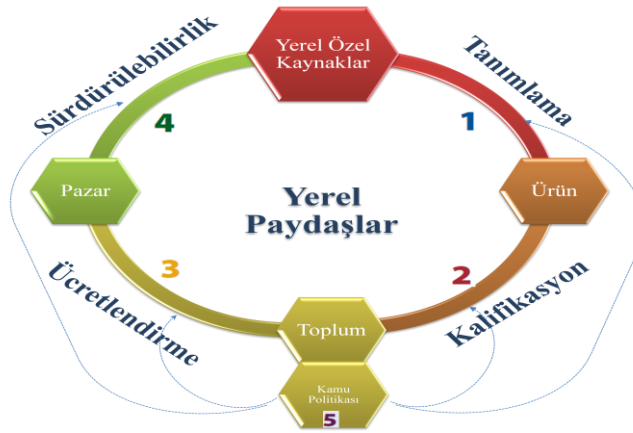
Şekil 4. Coğrafi işaretlerde ürünün menşine dayalı olarak oluşturulan kalite-değer döngüsü (Vandecandelaere vd., 2009)

Coğrafi işaretlere bağlı Yerel Ekonomik Kalkınma (YEK) modelinin oluşturulmasında coğrafi işaretin etkin olarak kullanılabilmesi için şekil 4'te sunulan döngünün etkin bir şekilde işlemesi gerekmektedir. Burada coğrafi işaret sisteminin oluşmasında ana noktada yerel paydaşlar bulunmaktadır. Coğrafi işarete sahip ürünün arz ve değer zinciri üzerindeki paydaşlar belirlenmeli ve rolleri ortaya konulmalıdır.