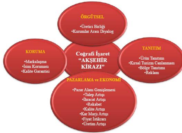
Şekil 3. Araştırma Bölgesindeki Paydaşların Coğrafi İşaretten Beklentileri

Bu nedenlerle coğrafi işaret sertifikasına sahip ürünlerin yerel/bölgesel kalkınmada önemli bir rol almaları beklenmektedir. Araştırma bölgesinde görüşülen paydaşların coğrafi işaretten beklentileri şekil 3’de özetlenmiştir. Şekil incelendiğinde araştırma bölgesinde coğrafi işaretten beklentiler, pazarlama alanında iyileşme ve bölgesel ekonomiye katkı olarak belirtilmiştir. Pazarlama alanında gelişme ve özellikle ihracat olanaklarının artması, fiyat artışı, pazar marjı artışı, fiyat istikrarı ve kalite artışı gibi unsurlar bölgedeki paydaşların ana beklentileridir.