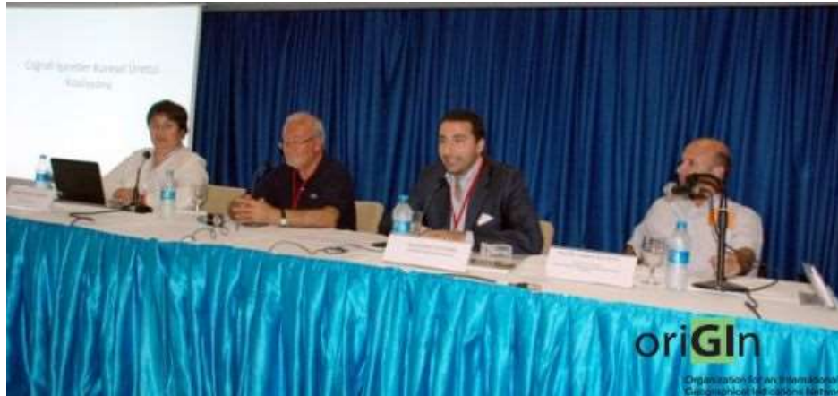
Séminaire international sur les IGs à YOREX Fair , Antalya (2012 )