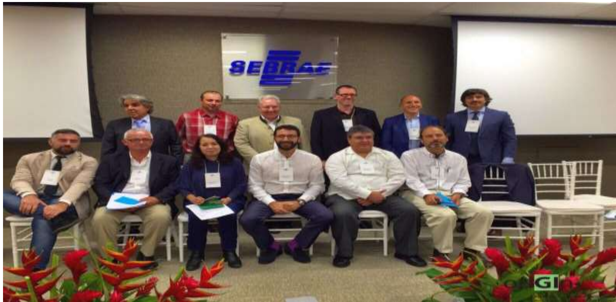
7 ème Assemblée Générale d'oriGIn Fortaleza, 10-12 Nov 15