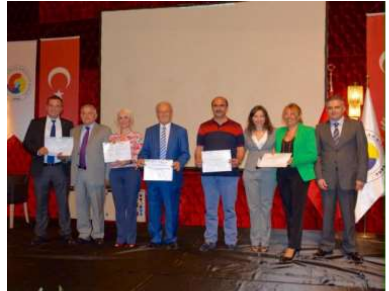
Séminaire international sur les IG , Izmir (2015 )