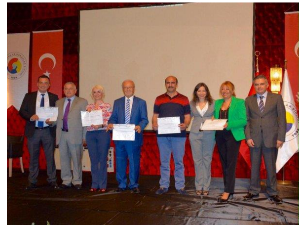
Séminaire international sur les IG , Izmir (2015)