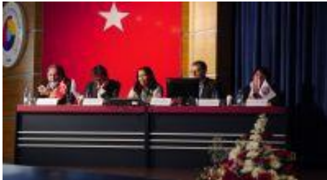
Séminaire international sur les IG à Mugla (2016)