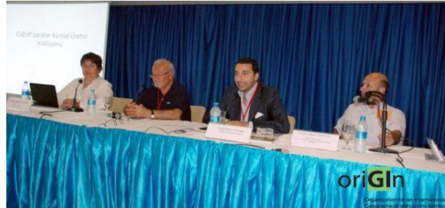
Séminaire international sur les IG à YOREX Fair, Antalya (2012)