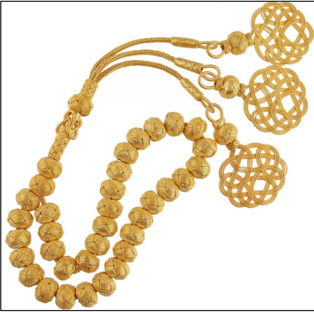
Şekil-1: Kazaziye işi altın tespih

Kazazlık ürünlerinin başında, bahse konu örgü formlarının birlikte veya tek başına kullanılmasıyla tespihlerin imame ucuna takılan “kamçı püsküller”, başlık ve şal püskülleri, kol ve gömlek düğmeleri gelmektedir. Günümüzde bu tekniği geliştirme çalışmaları sürdürülmekte ve çeşitli biçimde gerdanlıklar, bilezik ve küpeler üretilmektedir.(Şekil 1, Şekil 2 ve Şekil 3)