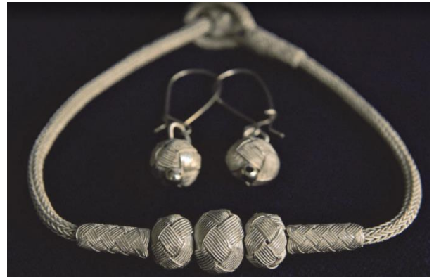
Şekil-2: Kazaziye işi gümüş bilezik ve küpeler