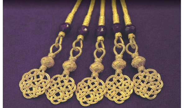
Şekil-7: “Şemse” motifli kazaziye işi kolye (altın)