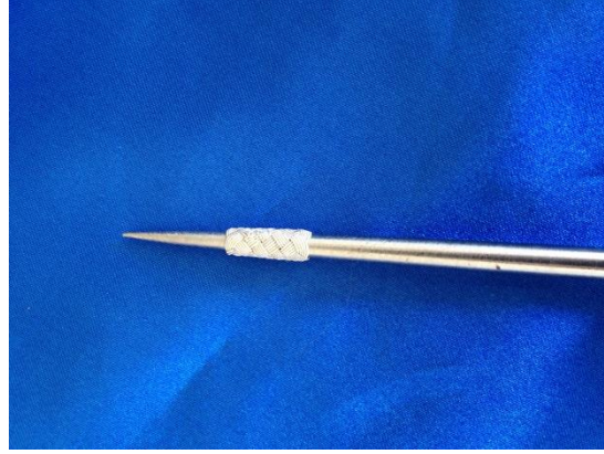
Şekil-5: “Yeminli sürgü” modeli