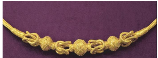
Şekil-3: Kazaziye işi gerdanlık

Örgü sırasında sarım işleri tığ, şiş ve minik top altlıkları üzerine uygulanmaktadır. Eskiden kurşun topların üzerine çirişli üçgen bezlerden yapılan minik toplar üzerine örülürken, günümüzde ahşaptan yapılan toplar üzerine örme işlemi gerçekleştirilmektedir. Kazaz yapımında kullanılan araç gereçler; çıkırık, tığ, sarmaşkı, gümüş/altın tel ve naylon/ipek ipliktir. Perdahlamak için salyangoz kabuğunun dişleri kullanılır. . Çıkırık; kazaziyenin yapılabilmesi için iplik üzerine tel sarılmasını sağlayan alettir. Tığlar ise çeşitli boylarda olup, top, kısa ve uzun sürgü yapımında kullanılmaktadır.Trabzon Kazaziyesi'nde “ajur” tekniğinde, örgü için çeşitli boy ve kalınlıktaki “sarmaşkı” ya da “sarmaşka” adı verilen araç kullanılmaktadır. Kazaziyede tellerin kullanılan iğnelerin deliklerinden geçirilmesiyle örgü teknikleri gerçekleştirilmektedir, kargaburunlar ise örgülerin yapımında iğnelerin geçmediği durumlarda ve düzeltmelerde kullanılmaktadır. Makaslar ürünün yapımının her aşamasında kullanılır.